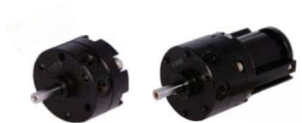
Привод поворотный лопастной серии 6420 размера 10...40